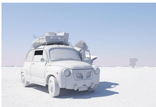
照明設定のプレビューレンダリング