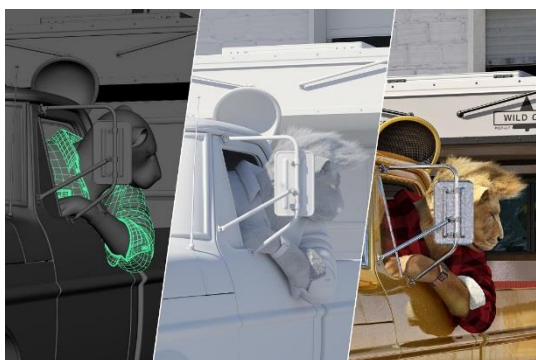
3D プレビュー / 照明テスト / 完成画像

制作プロセスは決してスムーズだったわけではなく、ミュラーの思い描くイメージが完成するまで、どの段階でも複数のテスト工程を要している。おびただしい数のディテールを統合するには途方もない時間が必要であり、『ライズ・オブ・ザ・ワイルド』シリーズは制作開始から完成まで実に3年もの年月を要したのである。