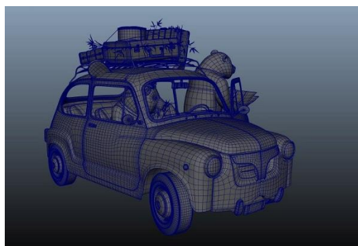
完成した 3D モデル